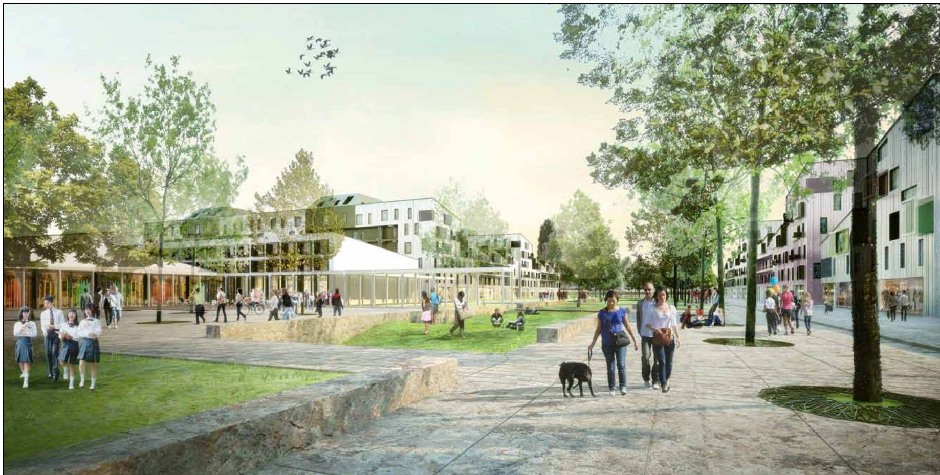
Perspective – vue du sol