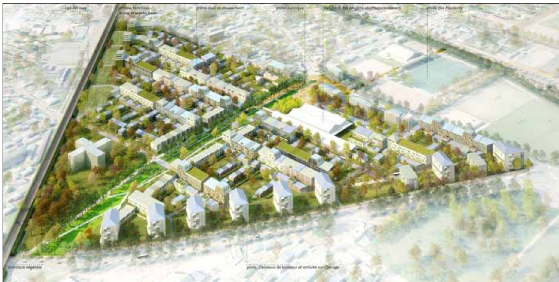
Perspective aérienne du projet