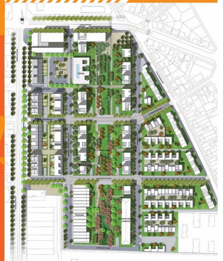
LE PROJET - 2002-2004