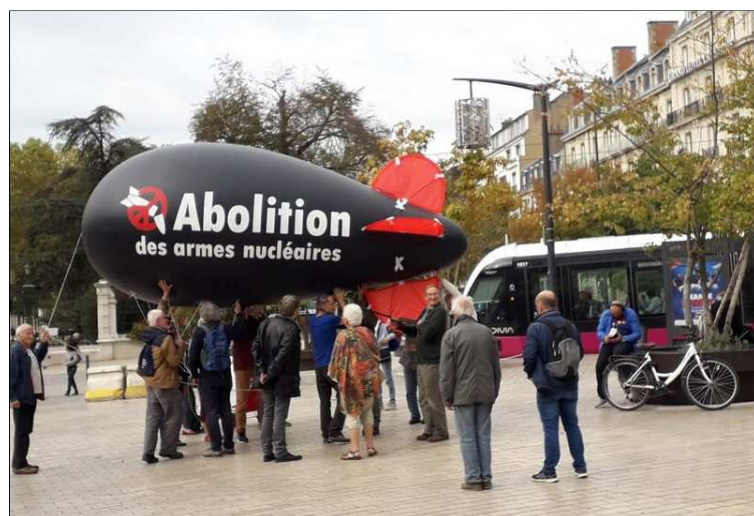
Place Darcy à Dijon, 14 octobre 2018